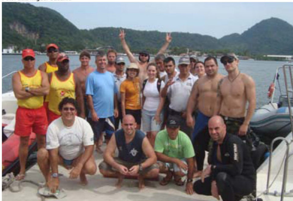
Figura 4 - Equipe, parceiros e colaboradores no final da Campanha Dive Clean no PEXJ em novembro de 2010.