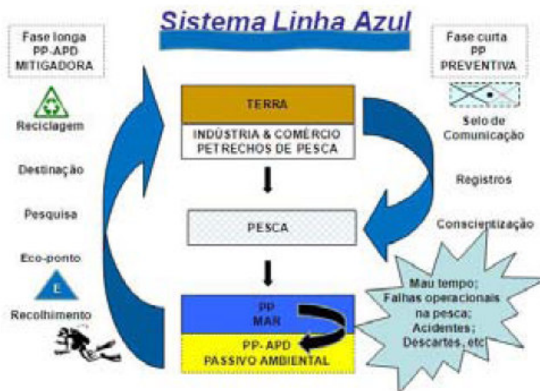
Figura 1 – Sequência das ações que envolvem as duas fases abrangidas pelo projeto.

Os principais objetivos do projeto são: recolher, de forma tecnicamente adequada, os PP-APD no Parque Estadual Marinho da Laje de Santos, no Parque Estadual Xixová-Japuí, e