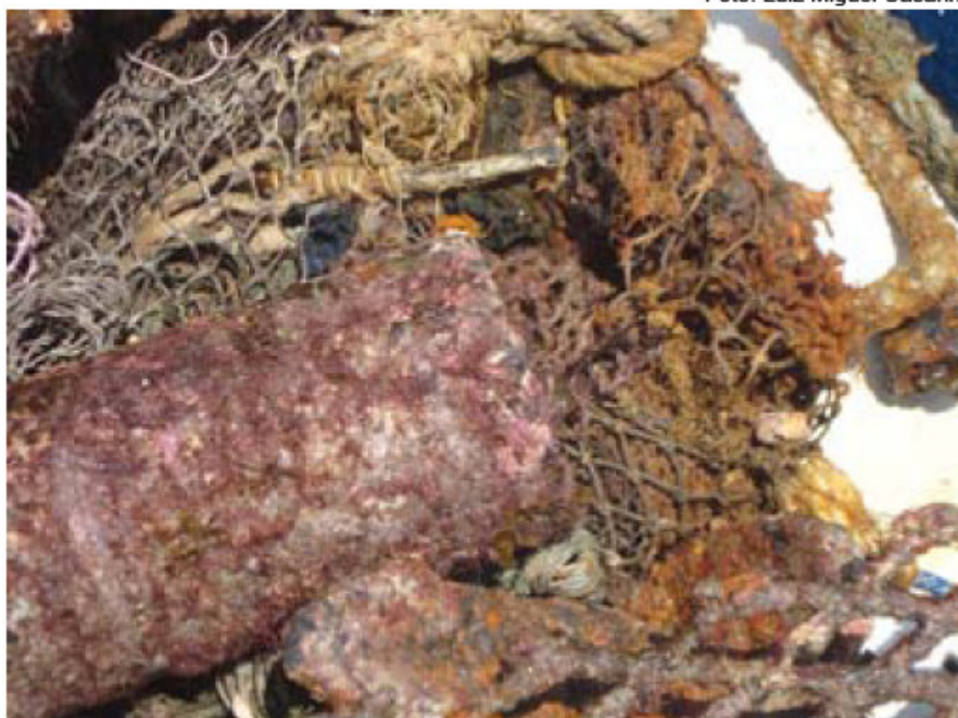
Figura 3 – PP-APD recém retirados durante Dive Clean no PEMLS em janeiro de 2010.