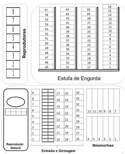
Figura 1. Planta baixa ilustrando as instalações das estufas do ranário comercial proposto no estudo.

Suas instalações detêm uma área total de 10.000 m 2 sendo 3.100m 2 de área construída. Esta área é composta por duas estufas agrícolas; 1 estufa de 1625,00 m 2 com 16 tanques de pré-engorda (13,00 m 2 ) e 41 tanques de engorda (19,00 m 2 ); 1 estufa de 1254,00 m 2 com 32 tanques de desenvolvimento embrionário (0,36 m 3 ), 34 tanques de girinagem (1,18 m 3 e capacidade para 4000 animais), 12 tanques de girinagem/metamorfose (8,82 m 3 e capacidade de 10.000 animais); 1 depósito de ração de 24,00 m 2 , 1 setor de reprodução de 68,00 m 2 com 8 tanques de postura de ovos (Figura 1).