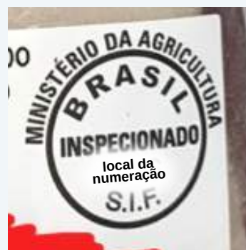
Figura 11: Selos dos Serviços de Inspeção Municipal, Estadual e Federal em produtos de origem animal disponíveis no comércio varejista.