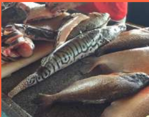
Figura 1: Acondicionamento INCORRETO do peixe no comércio, sem nenhum gelo.