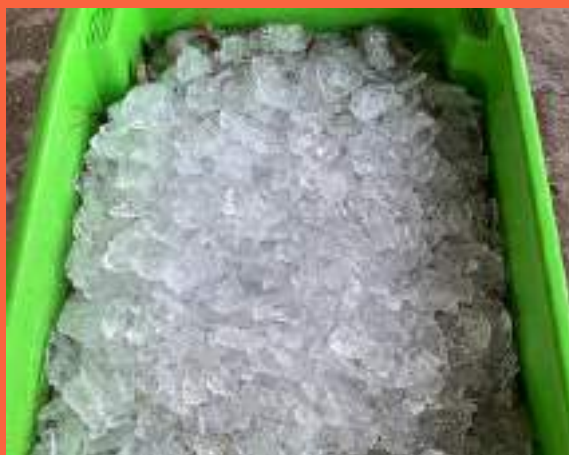
Figura 3: Acondicionamento CORRETO do pescado, completamente coberto por gelo (em cima, embaixo e nas laterais).