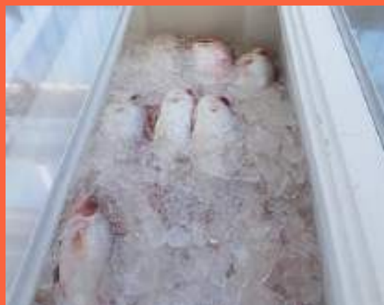
Figura 4: Acondicionamento CORRETO do peixe, que se apresenta inteiramente coberto por gelo.