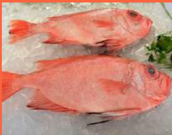
Figura 2: Acondicionamento INCORRETO do peixe no comércio, com a presença do gelo, no entanto sem cobrir inteiramente o alimento. Além disso, nota-se a proximidade de outros alimentos que podem ser fonte de contaminação.