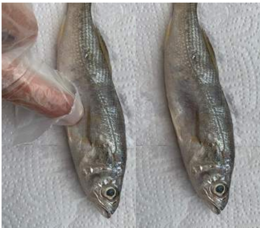
Figura 14: Características INDESEJÁVEIS – abdômen pouco firme, deixando impressão duradoura à pressão dos dedos.

d) Abdômen com forma normal, firme, não deixando impressão duradoura à pressão dos dedos ( Figura 14 );