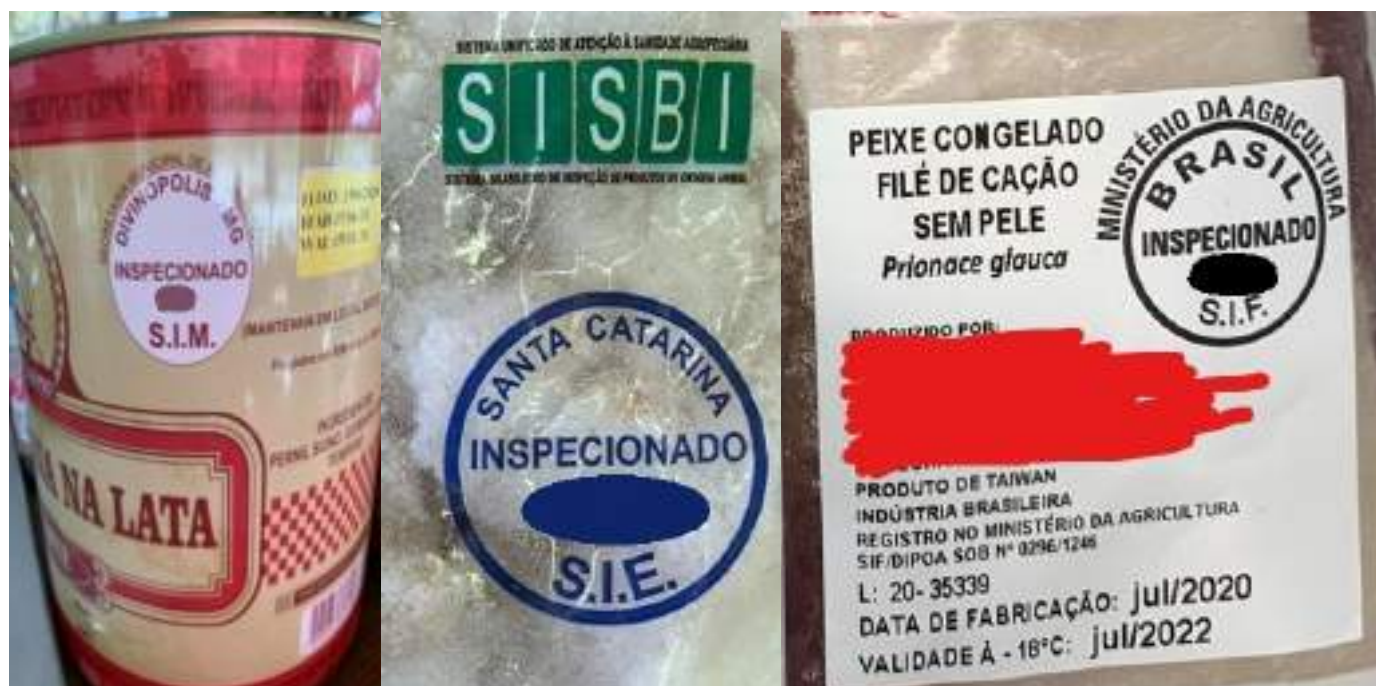
Figura17: Selos dos Serviços de Inspeção Municipal, Estadual e Federal em produtos de origem animal disponíveis no comércio varejista.

Estes selos garantem que o produto de origem animal tenha sido inspecionado por autoridade sanitária competente.