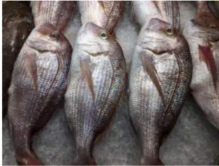
Figura 5: Peixes inteiros sendo vendidos no comércio varejista.

Inteiro: peixe íntegro contendo vísceras e cabeça, com ou sem nadadeiras ( Figura 5 ).