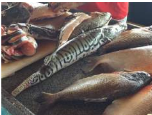
Figura 1 : Acondicionamento INCORRETO do peixe no comércio, sem nenhum gelo.