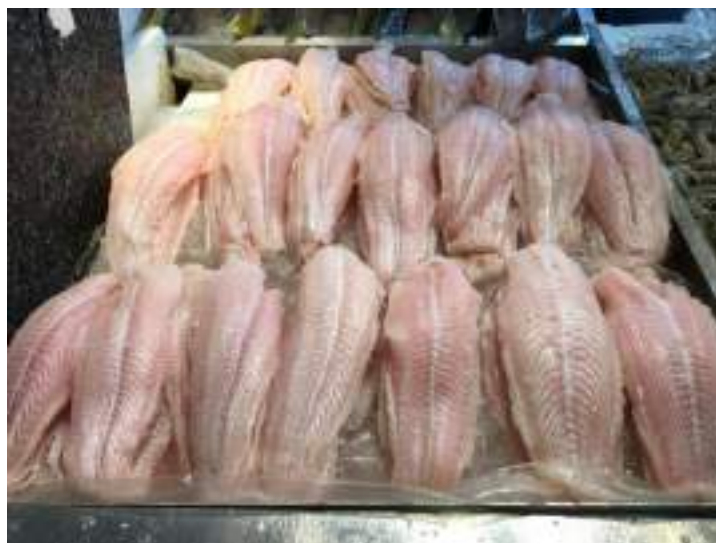
Figura8: Filés de peixe sendo vendidos no comércio varejista.

Filé: produto obtido a partir de corte único longitudinal da porção muscular desde a parte imediatamente posterior da cabeça até o pedúnculo caudal, no sentido paralelo à coluna vertebral ( Figura 8 ).