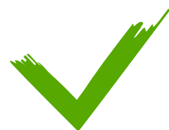
Figura 15: Características DESEJÁVEIS – escamas brilhantes, bem aderentes à pele, e nadadeiras apresentando certa resistência aos movimentos provocados.