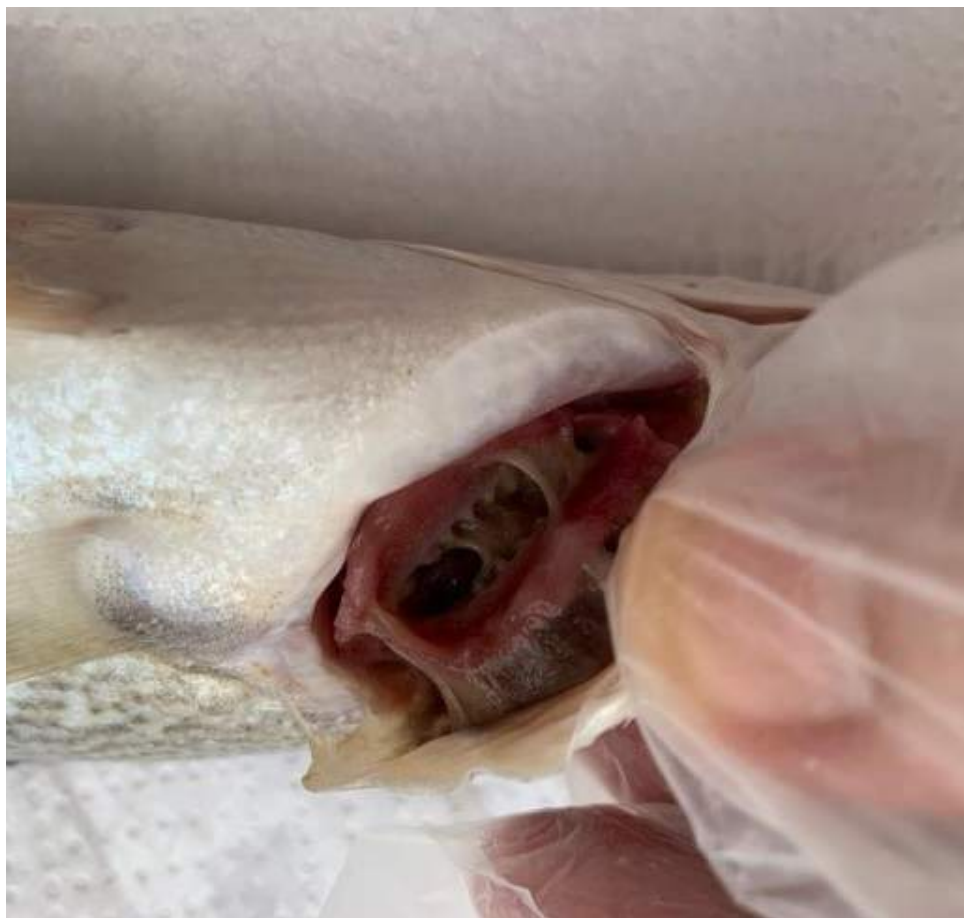
Figura 13: Características INDESEJÁVEIS – brânquias com coloração amarronzada, presença de muito muco, e odor forte.

c) Brânquias róseas ou vermelhas, úmidas e brilhantes com odor natural, próprio e suave ( Figura 13 );