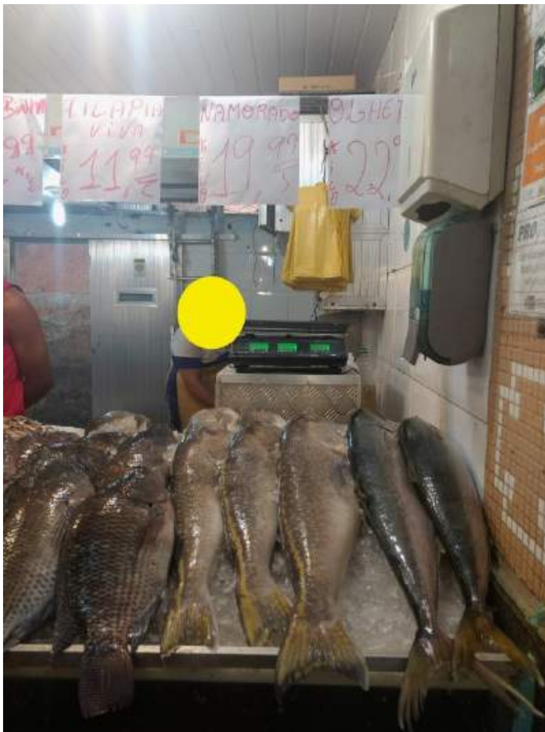
Figura 19: Batata sendo vendido como namorado no comércio varejista.