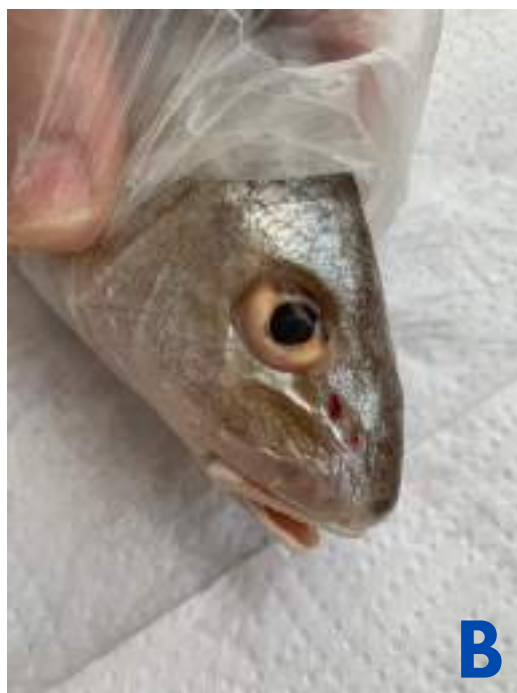
Figura 11:A- características DESEJÁVEIS de superfície corporal e olhos (claros, vivos, brilhantes, luzentes, convexos, transparentes, ocupando toda a cavidade orbitária);

Figura 11 B- características INDESEJÁVEIS – olhos amarelados, com perda de convexidade (“fundos”).