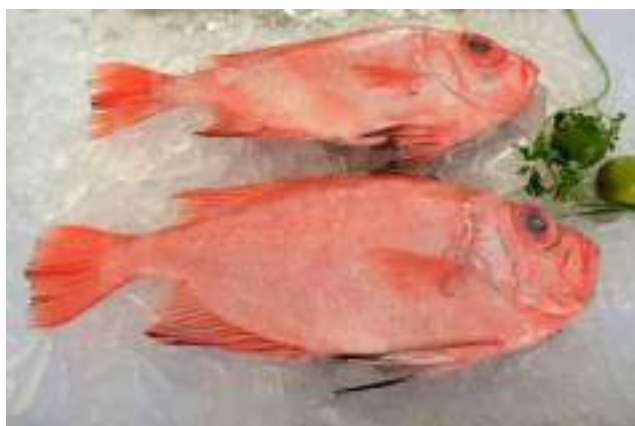
Figura 2: Acondicionamento INCORRETO do peixe no comércio, com a presença do gelo, no entanto sem cobrir inteiramente o alimento. Além disso, nota-se a proximidade de outros alimentos que podem ser fonte de contaminação.