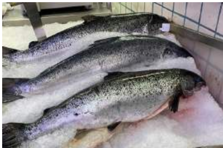
Figura 6: Peixes inteiros eviscerados sendo vendidos no comércio varejista.

Inteiro eviscerado: Peixe do qual foram removidas as vísceras. ( Figura 6 ).