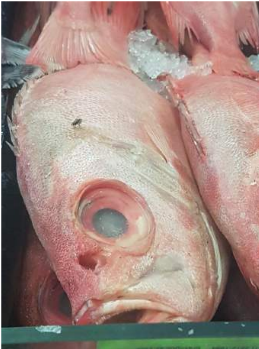
Figura 12: Características INDESEJÁVEIS - olhos opacos, com perda de convexidade, não ocupando toda a cavidade orbitária (“fundos”), além da presença de inseto no animal.