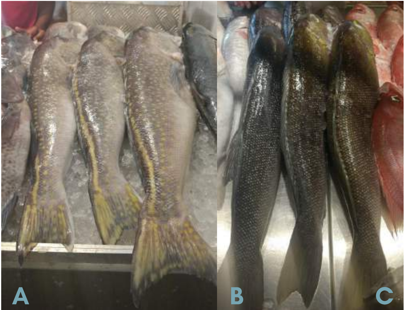
Figura 18: Diferenças entre as espécies, onde: A= Batata; B= Namorado macho; C= Namorado fêmea.