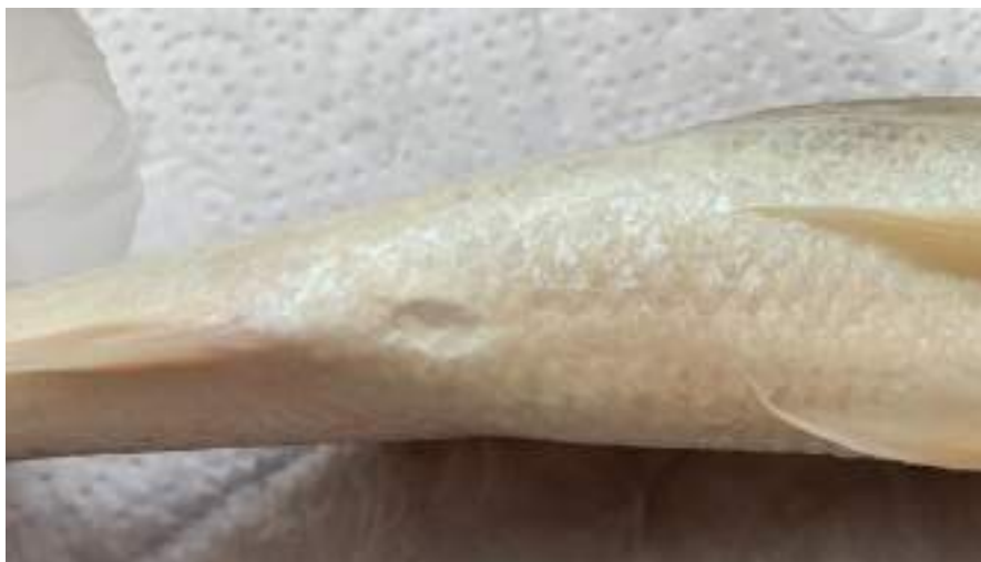
Figura 16: Características DESEJÁVEIS – ânus fechado.