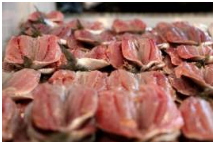
Figura 9: Filés de peixe espalmados sendo vendidos no comércio varejista.

Filé espalmado: produto constituído de filés unidos pelo dorso ( Figura 9 ).