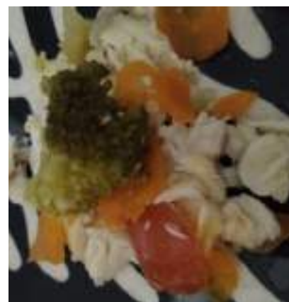
Figura 20: Preparo do peixe no papillote e resultado final.