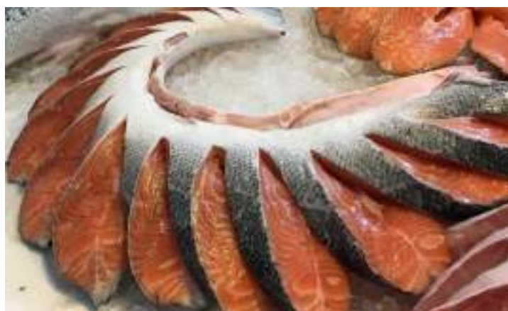
Figura 10: Postas de peixe sendo vendidas no comércio varejista.

Posta: produto obtido de cortes transversais à coluna vertebral do peixe eviscerado sem cabeça e removida a nadadeira caudal ( Figura 10 ).