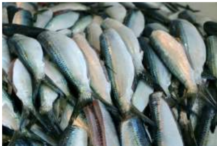
Figura7: Peixes eviscerados sem cabeça sendo vendidos no comércio varejista.

Eviscerado sem cabeça: peixe do qual foram removidas as vísceras e a cabeça ( Figura 7 ).